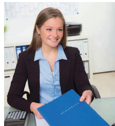
Bei Zeitarbeit handelt es sich um eine sozialversicherungspflichtige Beschäftigungsform.

Fakt ist, dass viele Zeitarbeitsunternehmen in der Region seit Langem über diesem Tarif bezahlen.